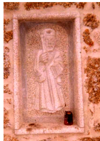
Saint-Jacques, cap Finistère

Avoir un couvre-chef est indispensable pour se protéger de la pluie, du soleil, du froid. Il est fort utile quelque soit la saison.