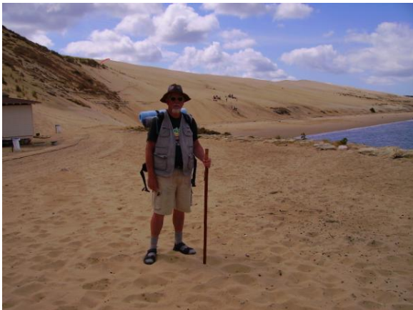
La Dune du Pilat

Il existe, parallèle à la voie de Tours, un autre chemin pour Compostelle : la Voie littorale. Elle commence à Soulac et conduit à Bayonne en suivant l'Atlantique (ou Ostabat si on reprend la voie de Tours à Le Barp). Cet itinéraire a été utilisé par les pèlerins de l'Europe du Nord qui débarquaient à Soulac. Avant la plantation de la forêt Landaise, le pays était marécageux et le chemin très difficile, au Moyen Age il était jalonné de commanderies de Templiers et d'Hospitaliers de Saint Jean de Jérusalem, l'abbaye bénédictine de Mimizan, 1000 Km de Santiago, abrite le plus ancienne statue de Saint Jacques en France.