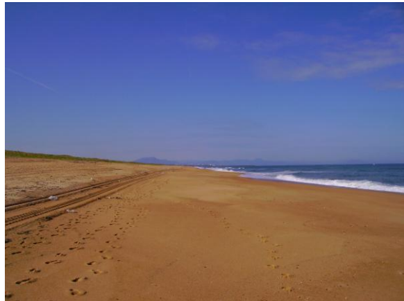
La plage à La Benne

Aujourd'hui la voie littorale est facile, elle suit le GR8 jusqu'à Mimizan, c'est une piste cyclable goudronnée peu agréable au marcheur. J'ai préféré marcher pieds nus sur la plage ou la dune qui n'abrite pas les moustiques ni les mouches plates. Sur la plage, il suffit de marcher vers le Sud avec la mer à droite.