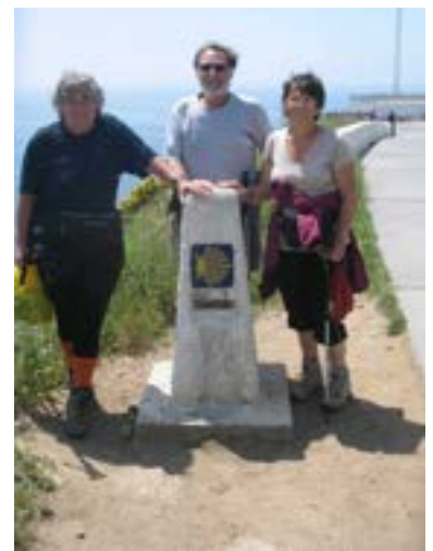
LA BORNE 00 KM