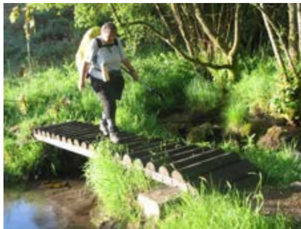
PONT SUR LE CAMINO FISTERRA