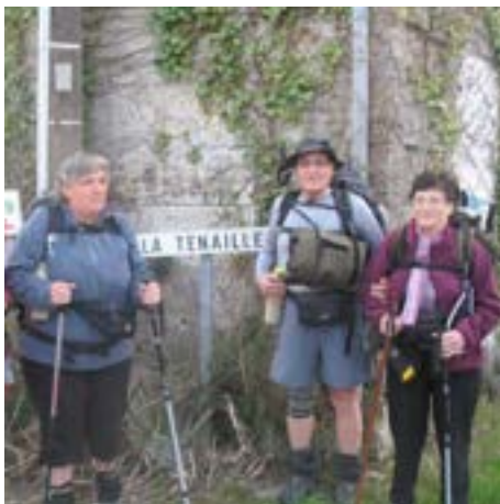
3 ème JOUR