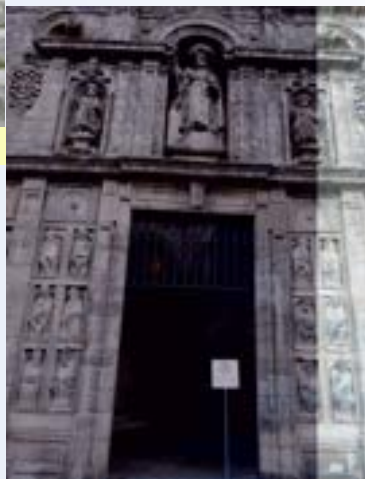
La porte Sainte vient d'ouvrir...

Le passage des Pyrénées reste pour beaucoup l'entrée du chemin mythique et un mois de ligne droite «Le Camino Francés». La densité des pèlerins est présente, les rencontres diverses et variées peuvent être nombreuses ; des espagnols qui aiment bien leurs pèlerins sont toujours prêts à rendre