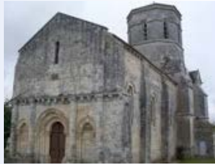
Église de Rétaud

« Nos églises romanes de Saintes à Pons »