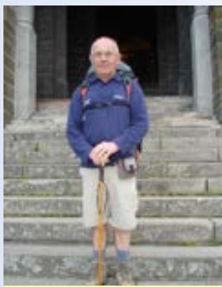
Le Puy-en-Velay 2006

Partir au départ de chez soi comme le veut la tradition, d'un lieu mythique comme la Cathédrale du Puy en Velay ou d'un endroit personnel que l'on aime bien, 10 000 manières personnelles de faire son chemin. C'est une aventure, car cela est et reste une véritable démarche qui ne peut être prise à la légère, tant physiquement que mentalement et matériellement. Un départ sans préparation ni motivation est voué à l'échec rapidement, comme le dit si bien notre infirmier/pèlerin « Vous devez partir avec un sac bien préparé, des chaussures confortables comme des chaussons et laisser sur le seuil de votre porte tout le reste ».