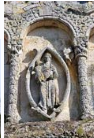
La Vierge en mandorle église de Rioux

Vous trouverez le déroulement du week-end dans l'agenda page 10 et sur la page « actualités » de notre site Internet.