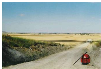
Meseta (Camino Francès)

(1) « Rencontres sur les Chemins de Saint Jacques » Denise Péricard-Méa – Editions Atlantica 2003 64600 ANGLET – Tel 0559528400