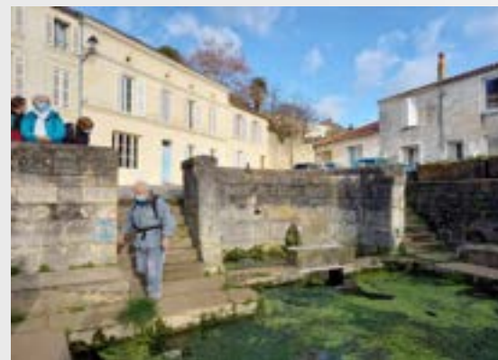
La Grand Font le 17 janvier...