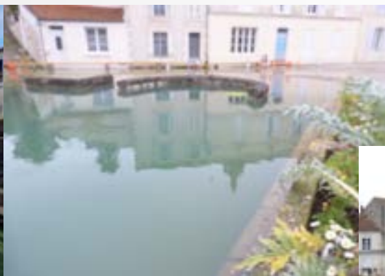
Ce que l'on en aperçoit le 9 février !

Les vieux Saintais se souviennent avec émotion que se tenait ici la fête de St Eutrope jusqu'en 1970 où elle rejoindra le Parc des Expositions avec ses manèges de plus en plus importants.